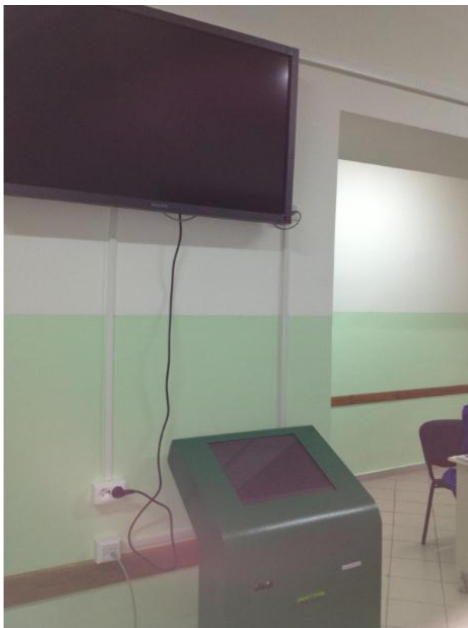
Пример установки информационного киоска и панели